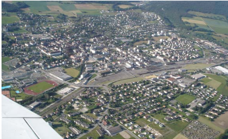
Les photos aériennes permettent de mieux voir les espaces non construits dans le tissu bâti ainsi que l'importance de la maison individuelle.

A long terme, cette politique d'agglomération se traduira par un instrument d'aménagement du territoire concret : le plan directeur régional. L'élaboration d'un tel instrument constitue une excellente opportunité pour évaluer les atouts spécifiques d'une entité territoriale et initier une dynamique de valorisation dans différents domaines (urbanisation, transports et communications, nature et paysage, environnement, approvisionnement et gestion des déchets).