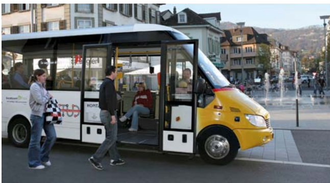
La navette qui assure les prestations de la nouvelle ligne 3 "Mexique – Gros Pré – Hôpital"