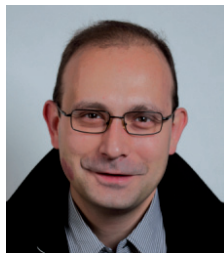
Question à M. M. Ryser , chef du Services des communes