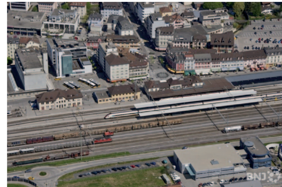
Le Conseil communal et le Conseil de ville recommandent à la population delémontaine d'accepter le 11 mars le crédit-cadre «Gare routière et vélostation».

La vélostation: une structure indispensable pour résoudre les problèmes de vols et de déprédations des vélos. Les infrastructures actuelles destinées aux deux-roues, cyclistes en particulier, ne garantissent pas une offre de stationnement suffisante et satisfaisante, tant du point de vue quantitatif que qualitatif (sécurité, confort, etc.). Elles doivent être complétées par la mise en place d'une vélostation, soit une structure sécurisée avec services annexes éventuels tels que petit entretien, services à domicile à vélo, etc.