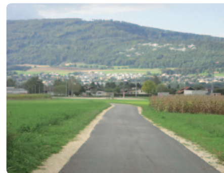
La piste cyclable et le chemin de randonnée pédestre de 2,9km entre Courroux et Vicques, par Bellevie.

Je n'oublie pas de mentionner également un chantier ambitieux: la première étape du réaménagement des rues du centre-gare à Delémont, réaménagement qui va donner à la capitale cantonale une allure urbaine moderne et attractive, digne de son rang et de son rôle de moteur du développement économique, social et culturel. A n'en pas douter, cela fera la fierté de ses habitants et le bonheur de ses usagers, en attendant les étapes suivantes prévues au Projet d'agglomération de 2 e génération. La Vieille-Ville en fera également partie.