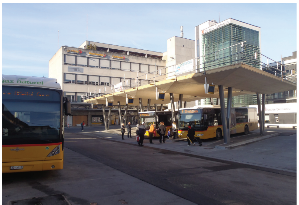
La nouvelle Gare routière de Delémont.

Le quartier de la Golatte n'est pas en reste: les bus de la ligne 12 le relie à la Gare à raison de trois fois par heure aux heures de pointe, deux fois par heure le reste de la journée.