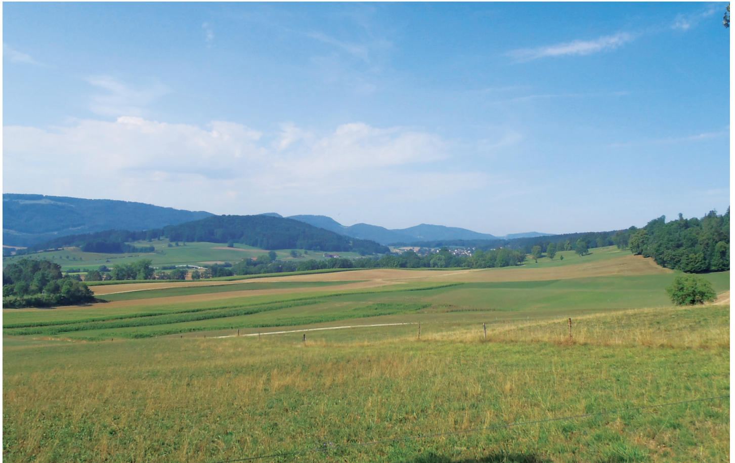
Vue sur l'espace agricole depuis le Domont.

(voir la carte ci-dessous). Cette stratégie favoriserait les communes se trouvant sur ce territoire. Dès lors, il a été demandé que la gestion des zones accueillant les grandes entreprises se fasse à l'image de ce qui s'est fait pour la SEDRAC en Ajoie, en intégrant toutes les communes de l'Agglomération et en redistribuant les recettes fiscales .