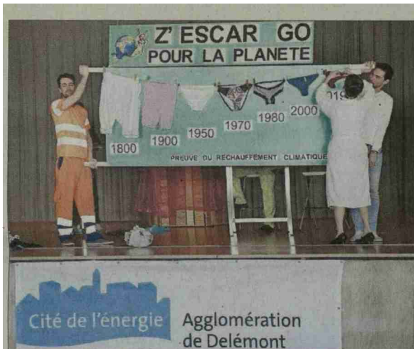
Une affiche consacrée au réchauffement climatique, imaginée par Théâtre Edgar qui a ouvert les feux de la partie officielle.