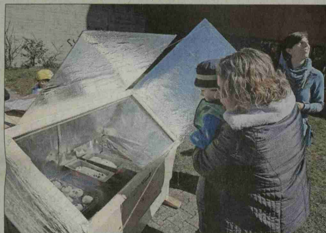
Divers ateliers, visites et stands ont animé la journée, comme ce four à pain artisanal fonctionnant à l'énergie solaire...