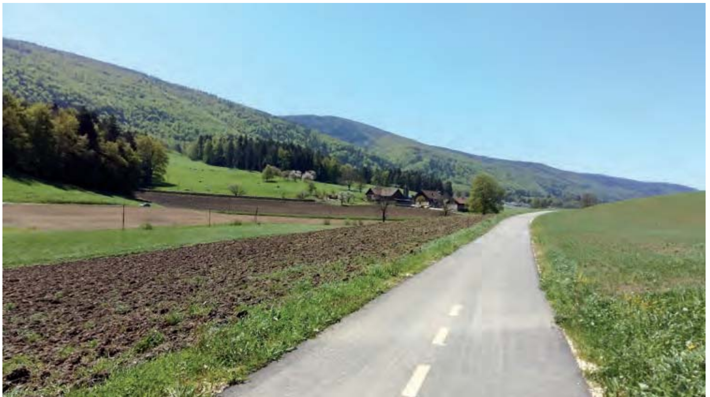
La piste cyclable entre Courrendlin et Châtillon est subventionnée par le programme d'agglomération de la Confédération.

Un programme plus détaillé sera donné prochainement.