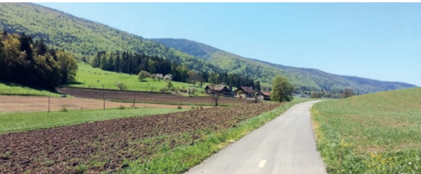
Liaison cyclable entre Courrendlin et Châtillon *