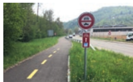
Liaison cyclable entre Soyhières et Delémont *

On a souvent tendance à surestimer le temps de déplacement à vélo. Par exemple, il ne faut qu'une dizaine de minutes à vélo classique pour rejoindre la gare de Courtételle depuis le centre de Delémont !