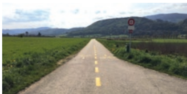
Liaison cyclable entre Courroux et Vicques *

* subventionnée par le programme de subventions de la Confédération